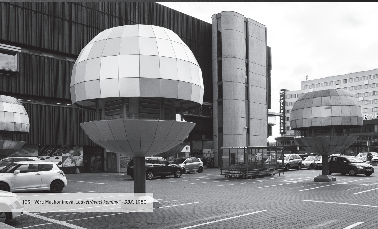
[05] Věra Machoninová, „odvětrávací komíny“ - DBK, 1980