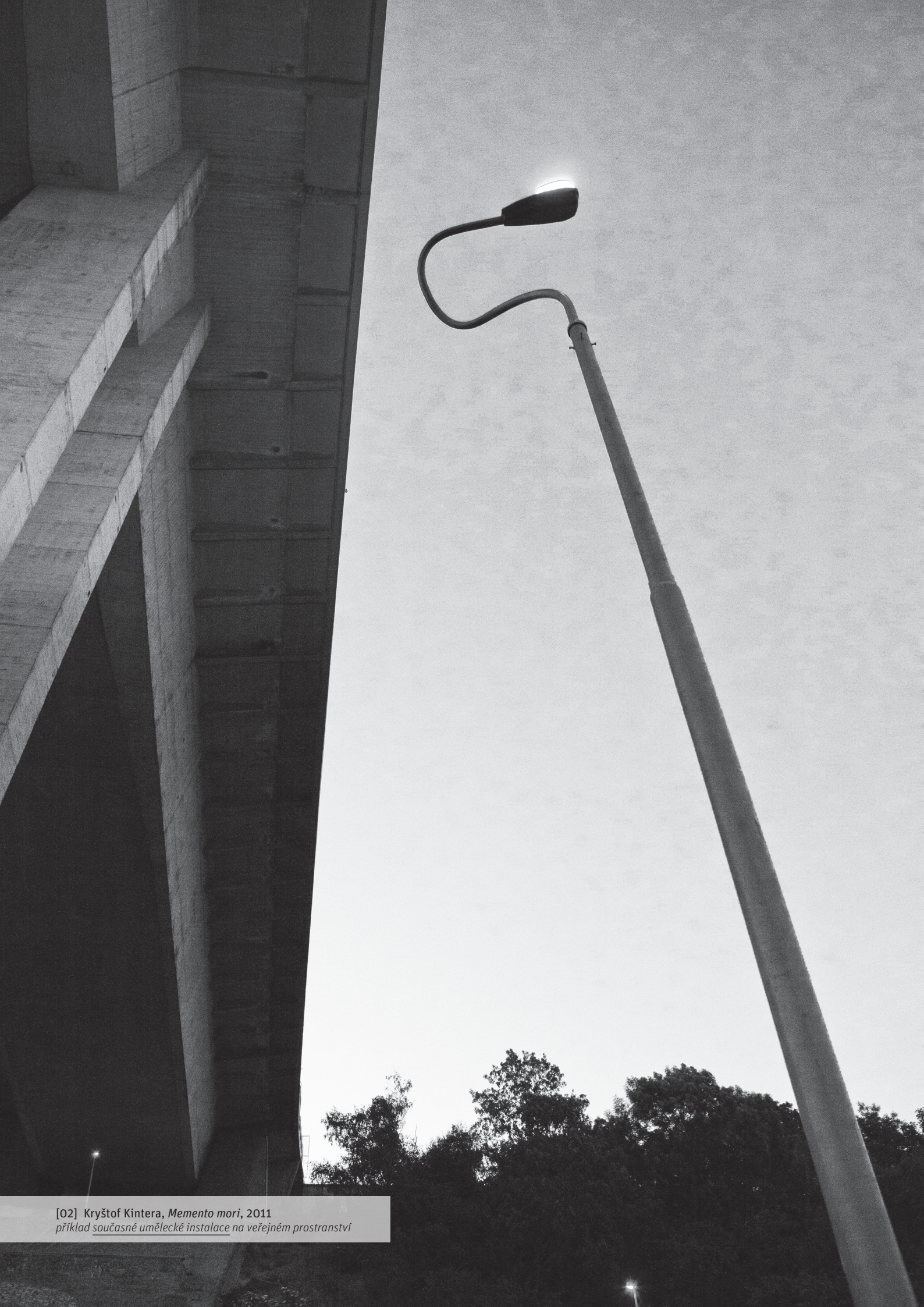
[02] Kryštof Kintera, Memento mori , 2011 příklad současné umělecké instalace na veřejném prostranství