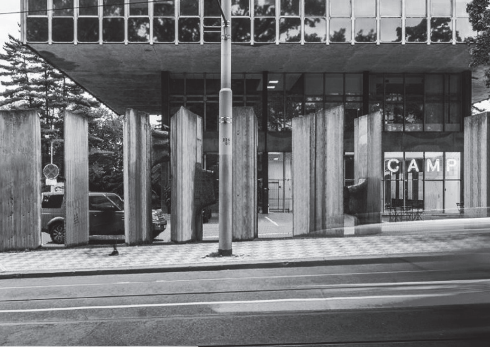
[04] Miloslav Chlupáč, sochařské doplnění vstupu , 1972