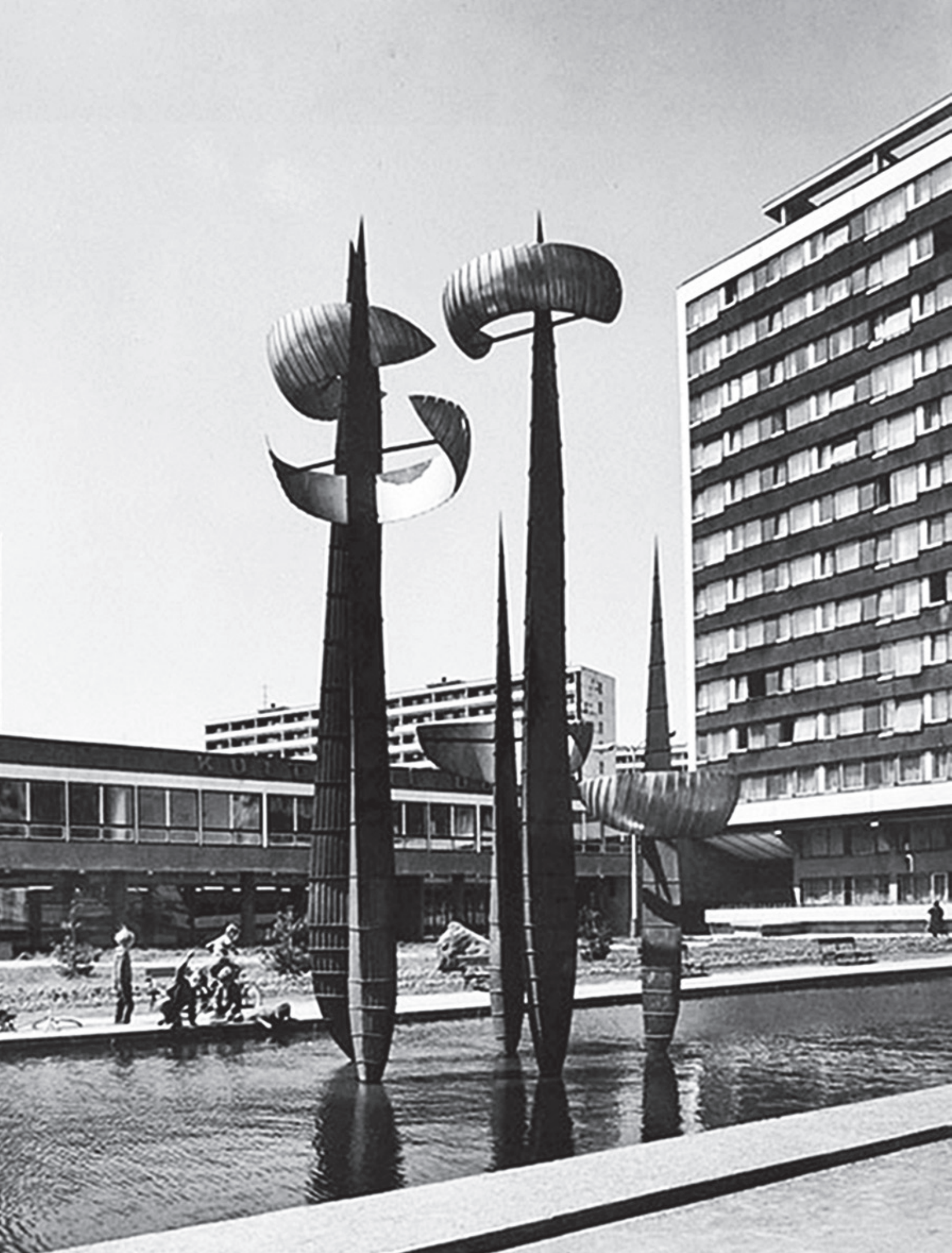
[06] Jiří Novák, Dálky/Distances ; pohyblivá struktura na náměstí sídliště Novodvorská; 1963, Praha/Novodvorská