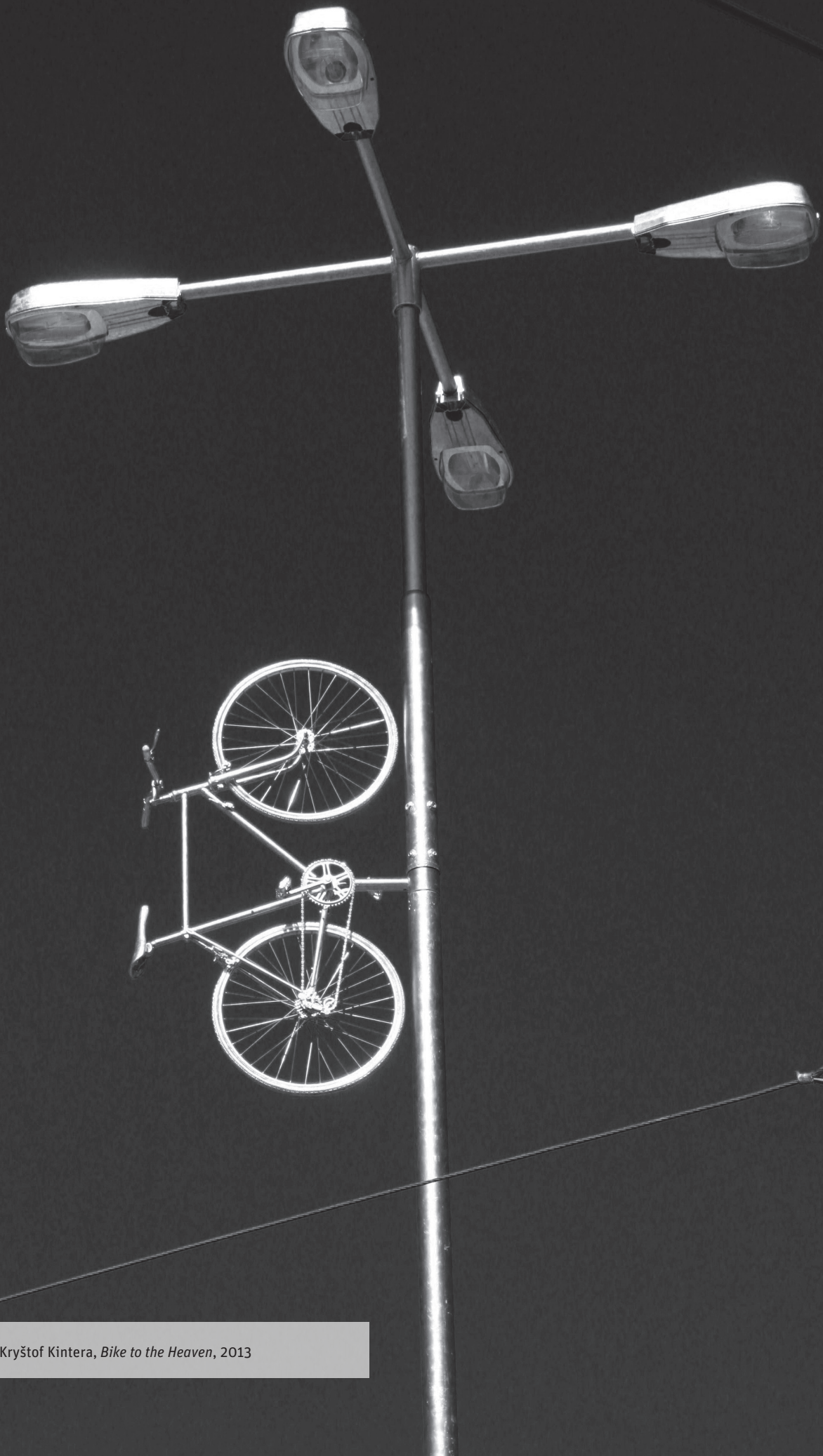
[03] Kryštof Kintera, Bike to the Heaven , 2013