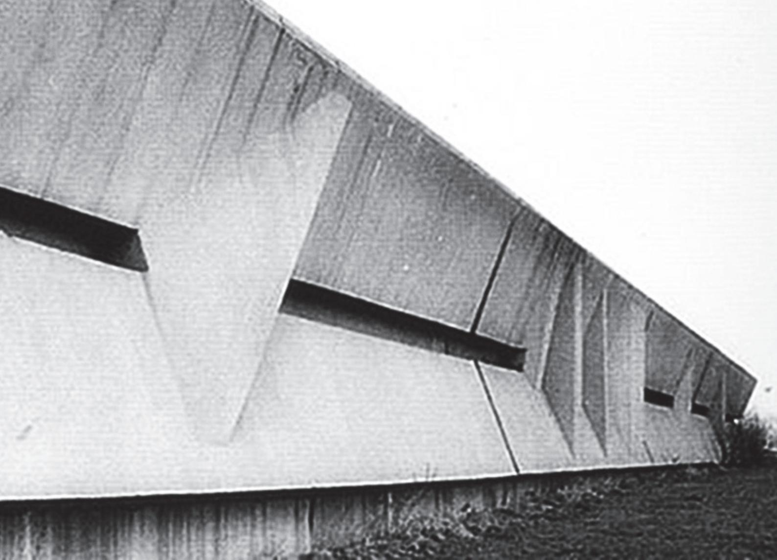
[01] Stanislav Kolíbal; sochařské ztvárnění opěrné zdi; 1968, Praha/Vyšehrad příklad zakomponování uměleckého/sochařského prvku v souvislosti s investicí/výstavbou Nuselského mostu